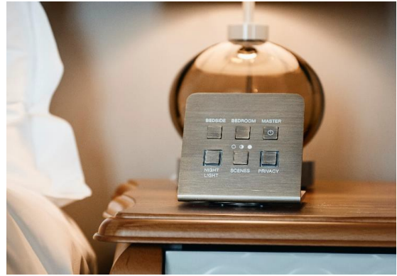
Пульт MELJAC для Mandarin Oriental Munich (система KNX)