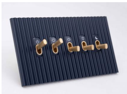
Коллекция Cannelée Meljas для Cheval Blanc Сэн-Тропе (Lutron)

Выключатели Meljas подключаются установщиком непосредственно к электрической панели или фиксируется в базовом модуле в утепленной коробке..