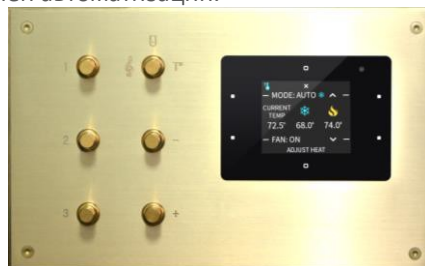
Обрамление клавиатуры Crestron в стиле Meljas

Meljas создает индивидуальные панели, чтобы интегрировать кнопки и экраны всех типов продуктов домашней автоматизации.