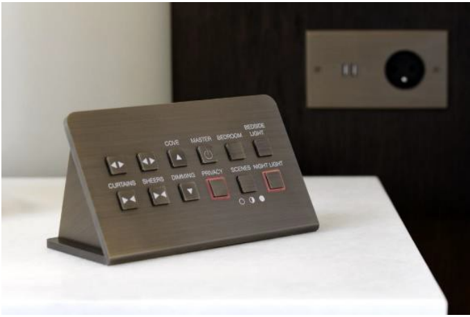
Пульт MELJAC для Mandarin Oriental Paris (система Incom Honeywell)