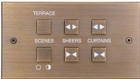
Коллекция Damier Meljac