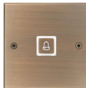
Латунь, отделка Bronze Médaille Allemand, кнопка с подсветкой, цвет гравировки белый