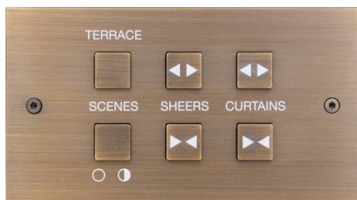
Латунь, отделка Bronze Médaille Allemand, цвет гравировок белый

Гравировки на кнопках (пиктограммы, слова, символы и т.п.) могут оставаться в той же отделке, что и пластина, или покрываться любым другим цветом для контраста.