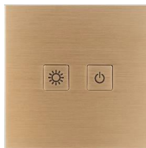
Латунь, отделка Bronze Médaille Clair